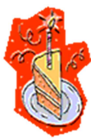
Abbildung 2 Das ist eine Geburtstagstorte